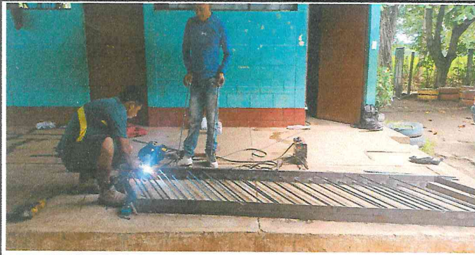
Foto1: Barandales de metal.